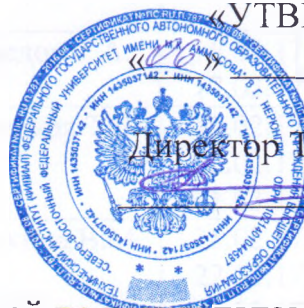
График приема задолженностей по результатам зимней экзаменационной сессии 2016/2017 учебного года по группам естественно-гуманитарного направления