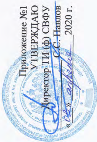
График дежурств ответственных лиц на объектах ТИ (Ф) СВФУ на время нерабочих дней с 04.04.2020 г. по 30.04.2020 г.